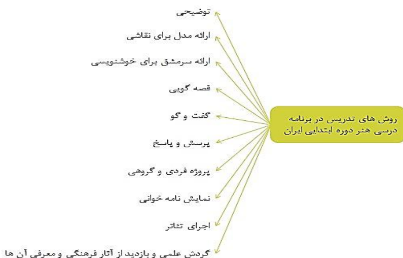
شکل ۱: جمع‌بندی روش‌های تدریس در برنامه درسی هنر دوره ابتدایی ایران

بر اساس حوزه یادگیری فرهنگ و هنر در سند ملی برنامه درسی ایران (۱۳۹۱)، اهداف دوره تحصیلی ابتدایی (۱۳۹۷)، راهنمای درس هنر دوره ابتدایی (۱۳۹۱) که برای معلمان شش پایه در ایران طراحی و تولید شده است. در شکل ذیل مهمترین روش‌های تدریس توصیه شده در این اسناد معرفی می‌شوند: