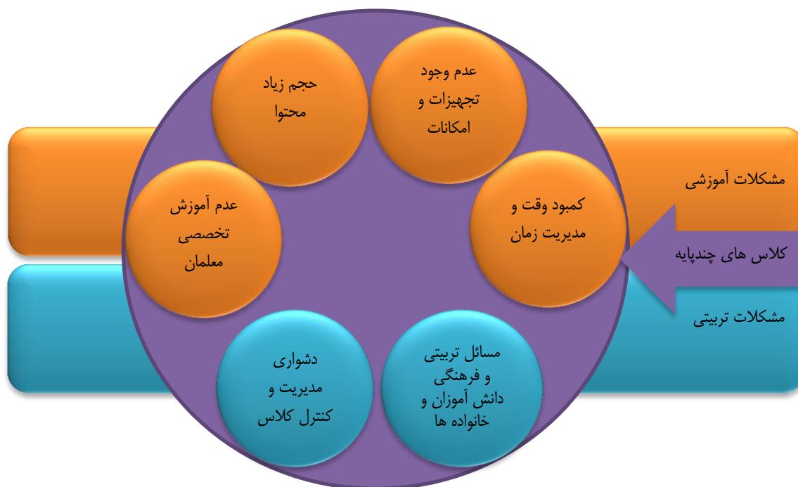
شکل ۱: مشکلات اصلی آموزشی و تربیتی کلاس‌های چندپایه از دید معلمان

می باشد. همچنین کوچک بودن فضای کلاس از جهت قرار گرفتن دانش آموزان پایه های مختلف در کنار هم عامل ایجاد مشکل تمرکز در دانش آموزان عنوان شده است.