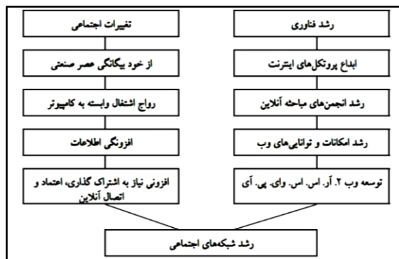
شکل ۱: اینترنت و تغییرات اجتماعی [۵]