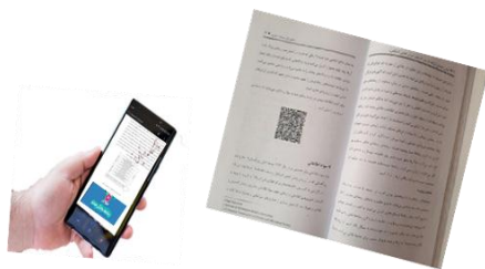
شکل ۱- نمونه ای از نسل جدید کتابهای دانشگاهی

تصویری از نسل جدید کتابهای دانشگاهی در شکل ۱ قابل مشاهده است.