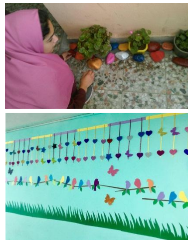
- راهکار جشن های رنگی، ورزشی، هنری، فرهنگی ...